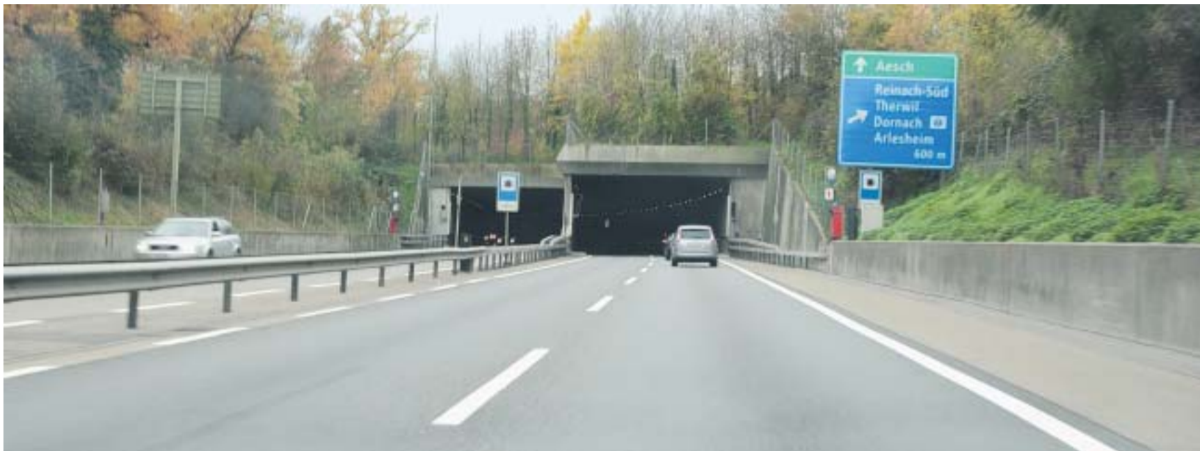
Strecke mit Gefahrenpotenzial. Kurz vor Tunneleingang wird der Blechpolizist bald die Autolenker an das Einhalten der Geschwindigkeit mahnen.

Münchenstein/Reinach. Der H18-Radar wird zu einer neuen Gefahrenzone verschoben